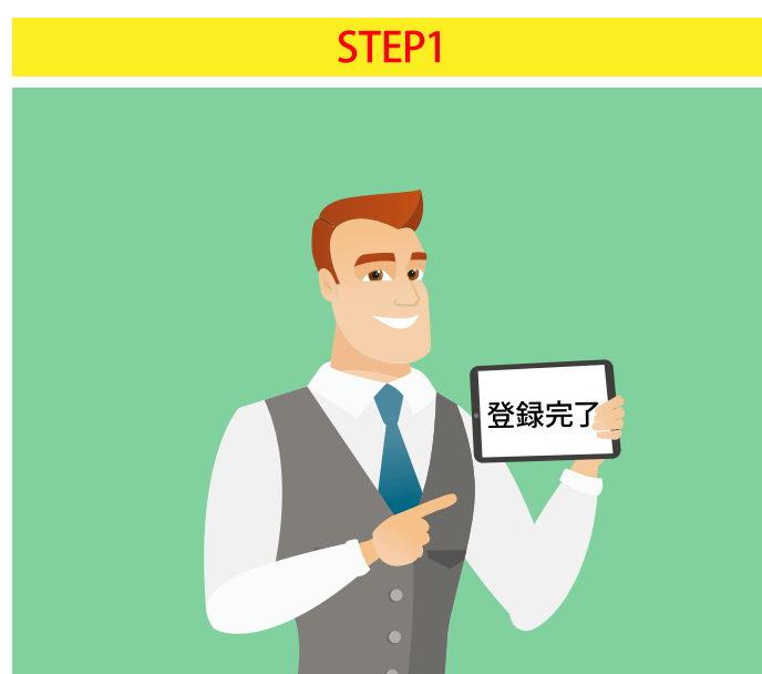
専用ページに登録