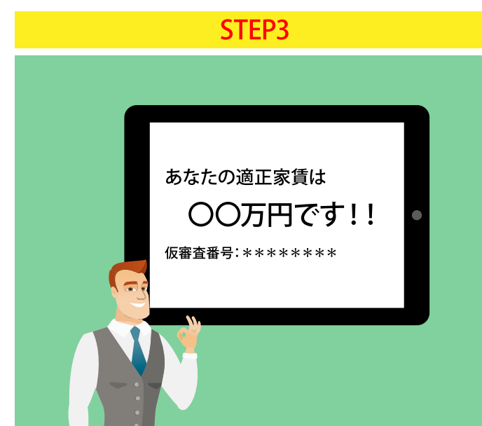
お客様に適正な家賃をお知らせし、仮審査番号を発行いたします